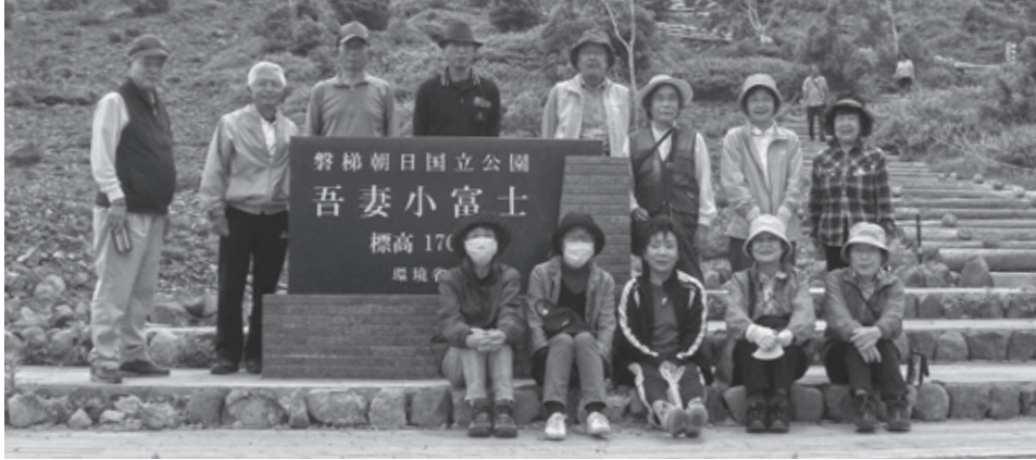
久世原ウォーキング班（感染予防をして、ちょっと遠くの浄土平へ）

生協に対して真剣に考えてくれる方々がいることが大変心強く思っています。そのような頼もしい運営委員は一四名で女性八人、男性六人という構成で毎月委員会をやっていきます。 今年で結成以来七年が過ぎましたが、これからもみなさんと一緒にいろいろな行事に取り組み、他の支部の経験なども学んで私たちも一歩ずつ更に前に進んでいきたいと思っています。