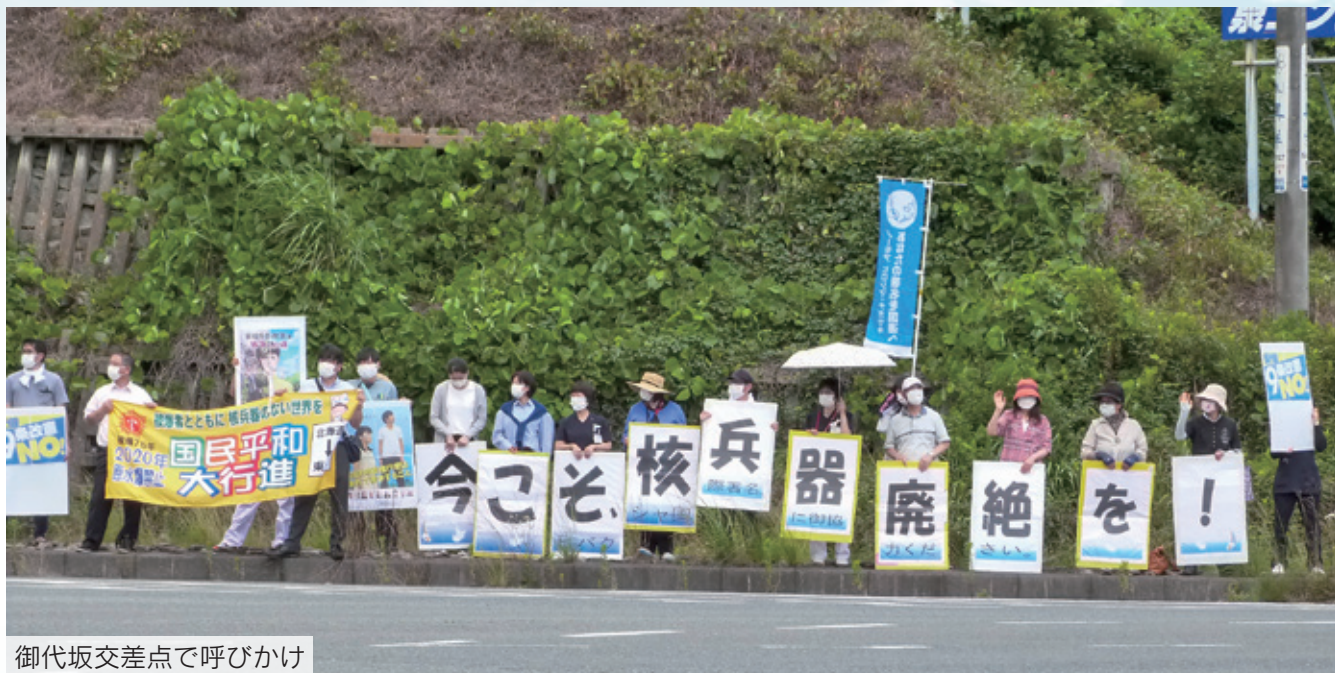
御代坂交差点で呼びかけ

「核兵器のない平和な世界」に……。核兵器廃絶とヒロシマ・ナガサキの被爆者の訴えをもとに、日本全国を行進する「原水爆禁止国民平和大行進」。一九五八年から六二回目の開催となる今年も、新型コロナウイルス感染症の世界的大流行により、各地で規模を縮小して行われました。 いわき市内は四倉・いわき・内郷・湯本駅前その他、岡小名御代坂・大島交差点にて行進からスタンディングにかたちを変えて実施しました。 浜通り医療生協では組合員・職員合同で最寄りの御代坂で実施。当日は五三名が「核兵器をなくそう」「へいわがいいね」と沿道へ呼びかけました。今年の開催が危ぶまれる中、スタンディングで実施できてよかったと参加者より声が寄せられました。 例年職員を派遣していた原水爆禁止世界大会は、被爆七五年の節目の大会でしたが、オンライン集会となりました。また広島市の平和公園内にある原爆の子の像へ組合員・職員が折った千羽鶴を大会派遣者が献納していました。右記の理由により、玉川の組合員さんが一年かけて折った鶴は広島医療生活協同組合を通じて現地へ送りまし