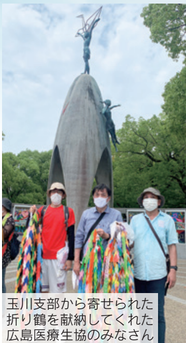
玉川支部から寄せられた折り鶴を献納してくれた広島医療生協のみなさん