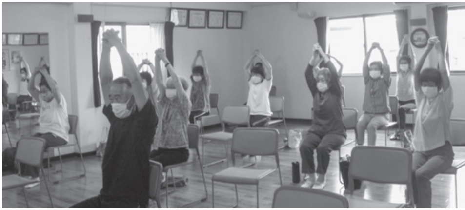
久世原体操班（感染予防の為、マスクをしながら体操中）

キング、バスハイク、健康チェックや原発事故視察、医療講演会など多彩な取り組みをしてきました。いろいろなことが出来たのも運営委員会のみなさんの努力と経験、そしてなによりも