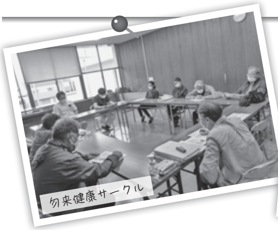
勿来健康サークル