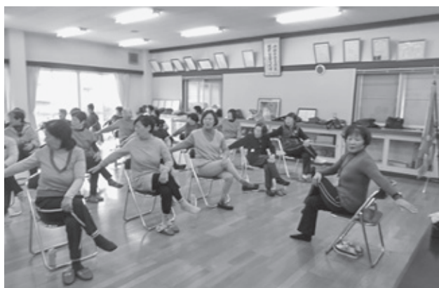
泉シルバー体操教室 市の指導員を迎え月4回実施中