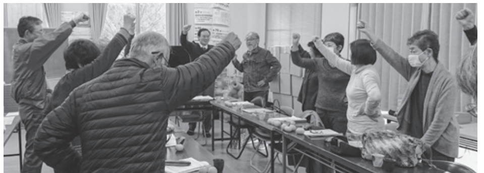
目標到達に向けて「えいえいおー!」