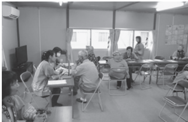
被災者支援健康チェック 2011年12月から2016年4月まで、毎月第一水曜日に実施し、延べ675名受診