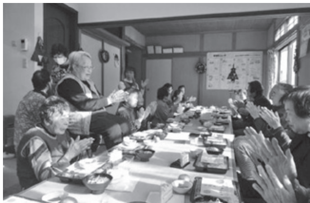
ミニデイサービス 2009年5月から始めました

四月まで、富岡町仮設住宅での健康チェックの取り組みを通して、医療生協活動の地域での役割や意義を深めあう事が出来た大変貴重な活動だったと思っています。 今後については、長年支部活動を支えてくれた数名の支部運営委員も、高齢や病气などで交代を余儀なくされ、次の担い手さん探しが喫緊の課題となっています。運営委員会内では、支部内の六〇名ほどのニュース手配りさんに対し、昼食交流会やバスハイイク交流会を企画して、みなさんとのつながりを育んでいます。他には、四年目となる市のシルバー体操指導士派遣事業を活用した、シルバー体操班には、玉露地域を中心に四〇名程と会員も増えており、地域のつながりを大切に「地域に医療生協があつて良かったね」という活動を通して、仲間づくりに重点をおいた取り組みを進めようとお話し合っています。